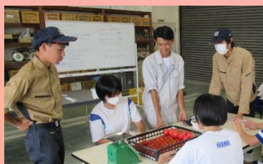
農業経営科体験実習