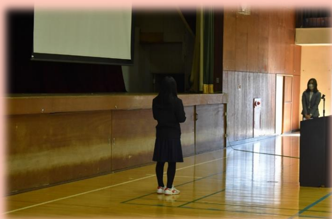
最後の謝辞の様子です